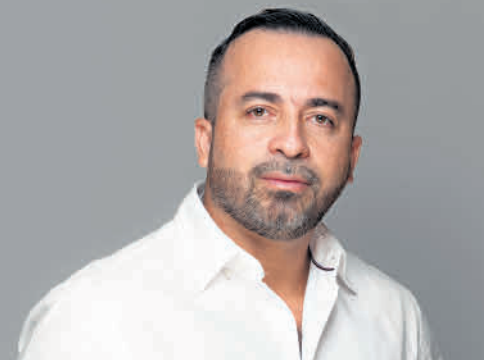
Aris Martínez / El Siglo