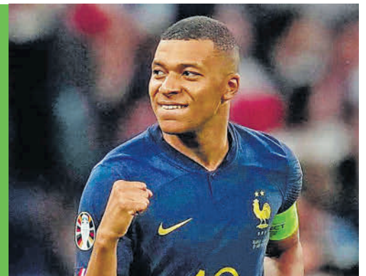
Daniel González / El Siglo