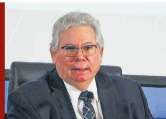
Miguel Victoria/ El Siglo