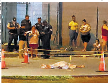
Aris Martínez/ El Siglo

SE LANZÓ DEL ANDÉN DEL METRO EN LAS MAÑANITAS, UN CAMIÓN ESTUVO A PUNTO DE PASARLE POR ENCIMA