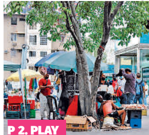
P 2. PLAY

EXPERTOS ALERTAN POR LA ALTA INFORMALIDAD LABORAL EN EL PAÍS