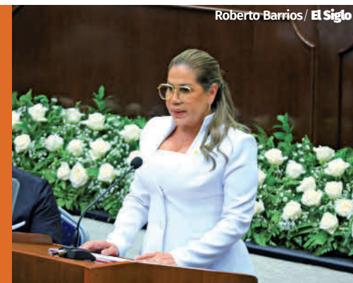
Roberto Barrios / El Siglo

Los móviles de los homicidios fueron los mismos de todos los meses: sicariato, pandillerismo y riñas. La provincia de Panamá fue una de las zonas más candentes en este mes. La población reclama más efectividad en los operativos policiales