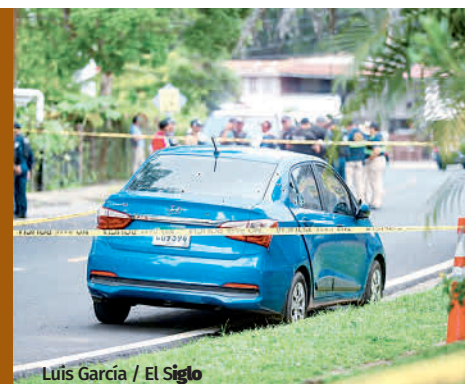
Luis García / El Siglo