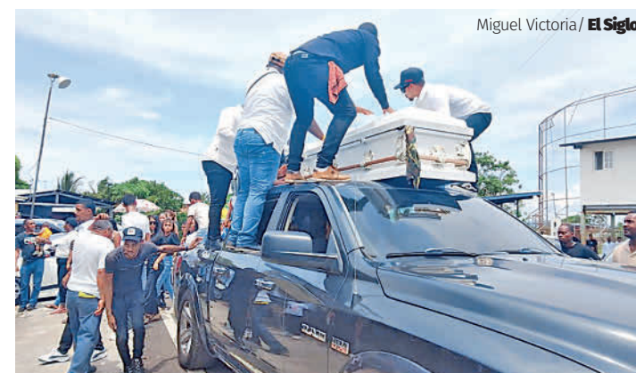
Miguel Victoria / El Siglo

El sepelio estuvo marcado por la tristeza y la incertidumbre de sus seres queridos, quienes aprovecharon el momento para exigir a las autoridades una investigación exhaustiva que permita esclarecer las circunstancias en las que ocurrió la muerte.