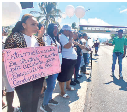
Comunidad exigió no más muertes por atropello.

Su aura refleja la luz del sol y el misterio de la sal. Y aunque las gafas esconden su mirada, no pueden esconder que su figura encaja en el paisaje más hermoso.