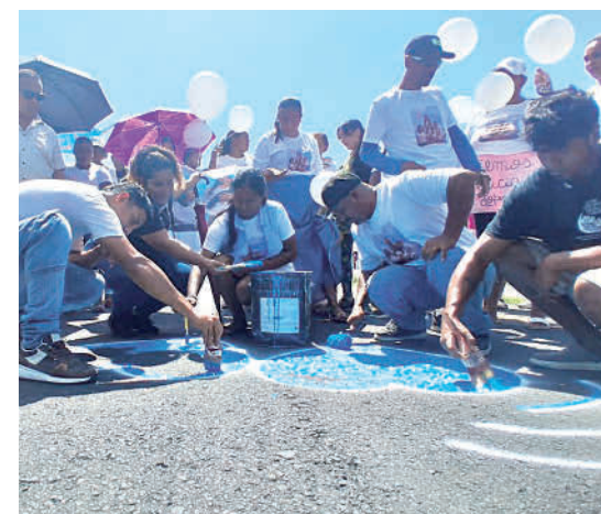
Los corazones recordarán la tragedia de La Ermita.