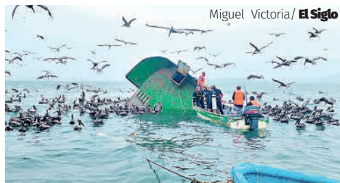
Miguel Victoria/ El Siglo