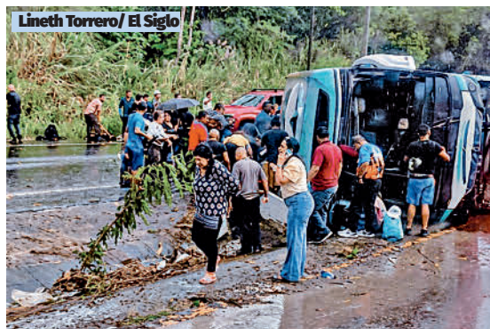
Lineth Torrero/ El Siglo

Las autoridades iniciaron las investigaciones para determinar las causas de este lamentable accidente que llena de luto a otros hogares panameños.