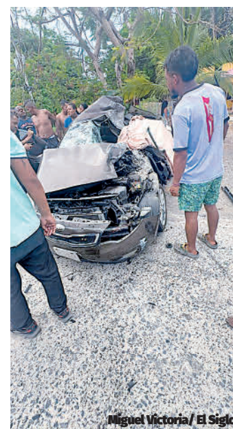
Miguel Victoria/ El Siglo

Montero, residente de El Ciruelito, permanecerá bajo custodia por el tiempo que duren las investigaciones del