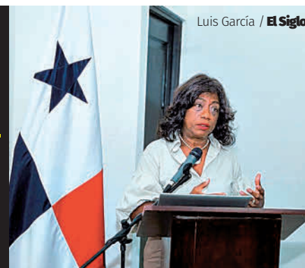
Luis García / El Siglo