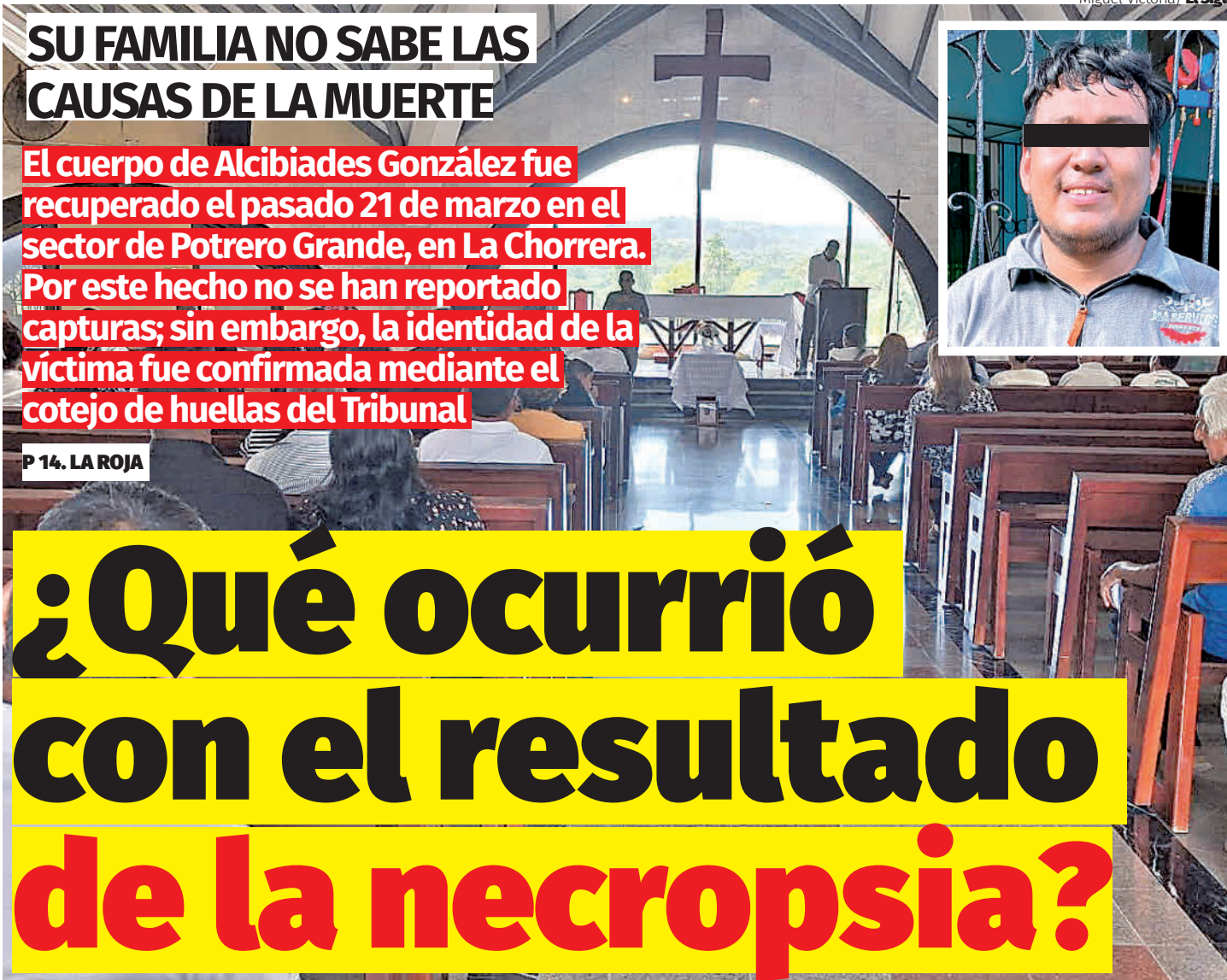
Miguel Victoria / El Siglo

¿Qué ocurrió con el resultado de la necropsia?