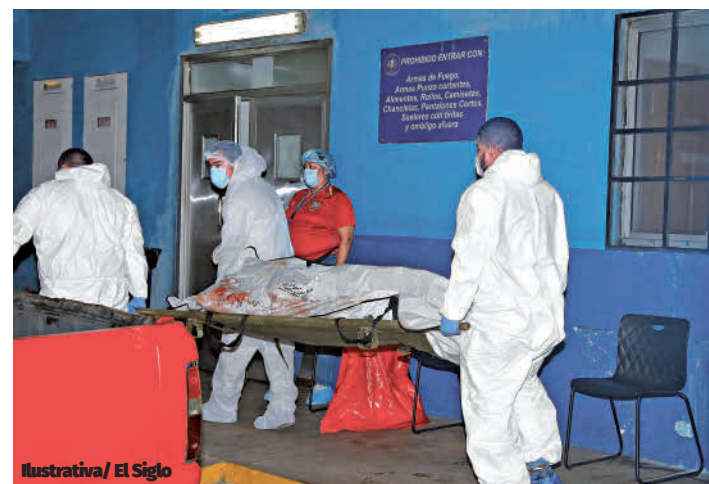
Ilustrativa/ El Siglo

Antes de este hecho, la madrugada del pasado viernes 3, la violencia ya