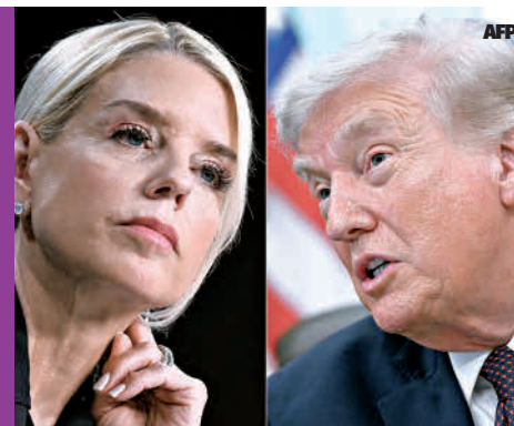
Miguel Victoria / El Siglo