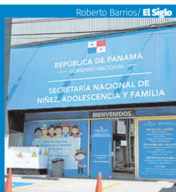
Roberto Barrios/ El Siglo