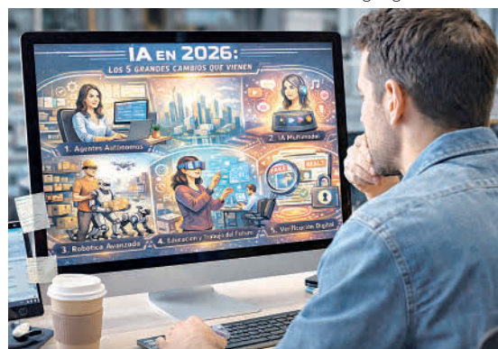
Imagen generada con IA