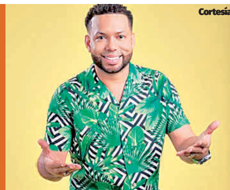
Miguel Victoria / El Siglo

SE PRENDIÓ DE NUEVO EL CASO DEL TIPIQUERO ALEJANDRO TORRES P 8. PLAY