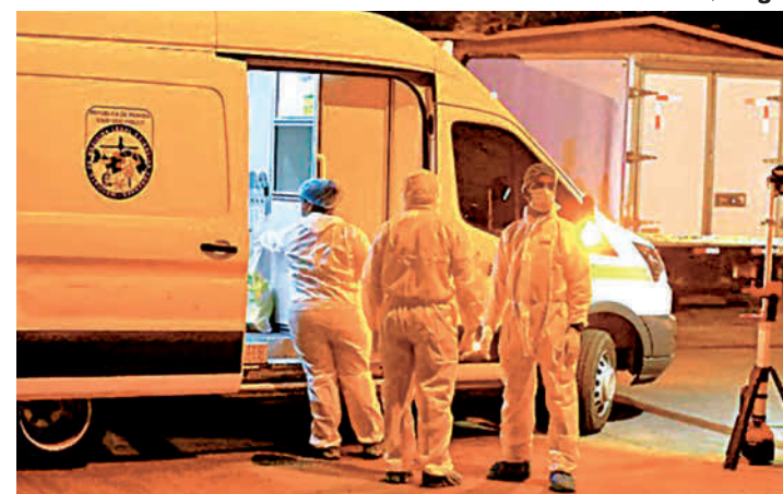
Ilustrativa/ El Siglo

Tras el sanguinario ataque lo llevaron de urgencia al Hospital Manuel Amador