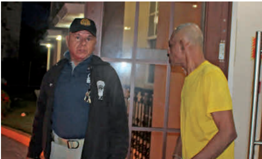
Elmer Quintero/ El Siglo

“Kenny actuaba normal, pero cuando llamaron y nos dijeron que habían encontrado a Lina y que la llevaron al hospital, él estaba sentado sobre un casillero vacío de cervezas e inmediatamente agachó la cabeza”, dijo el testigo en el estrado.