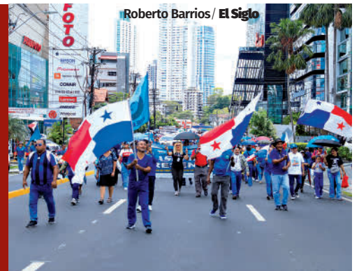
Roberto Barrios / El Siglo