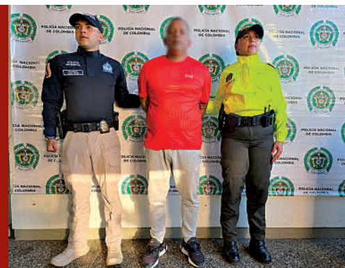
Aris Martínez/ El Siglo