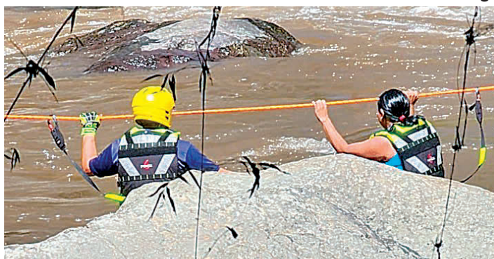
Elmer Quintero / El Siglo

El incidente ocurrió cuando el grupo se encontraba cerca del afluente, sin pre-