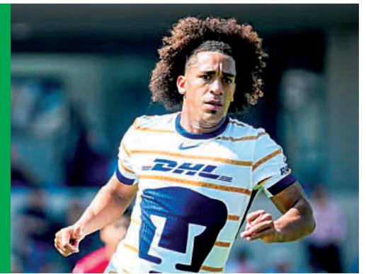
Johar Ferrara / El Siglo