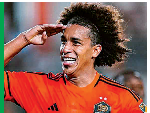
Miguel Ángel Victoria / El Siglo