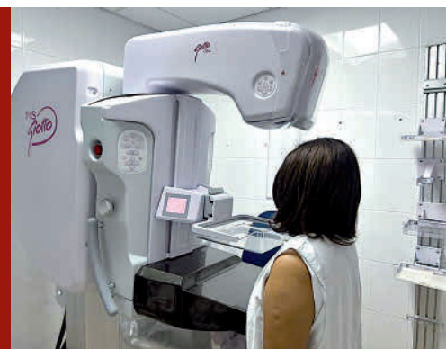
Elmer Quintero/El Siglo