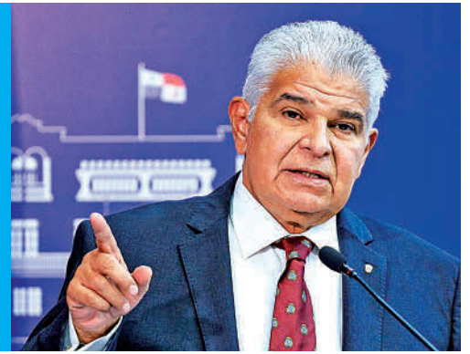
Didier Magallón/El Siglo