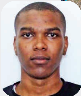
Lo quieren atrapar.