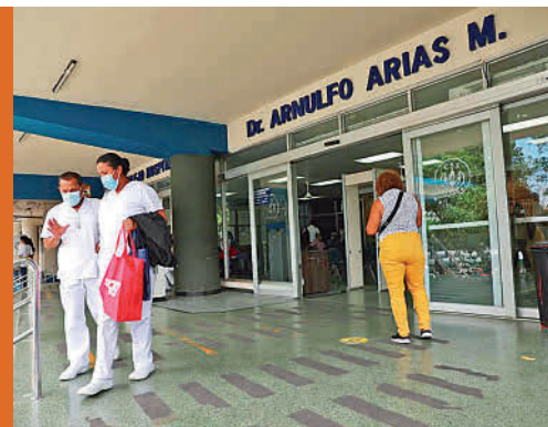
Miguel Victoria/ El Siglo