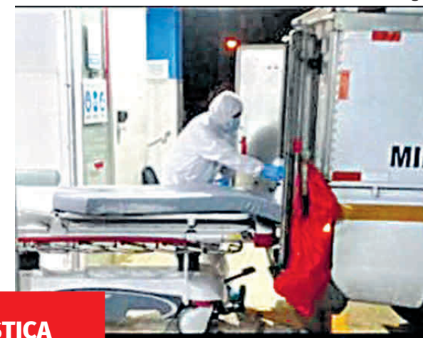
Elmer Quintero / El Siglo