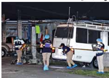
Didier Magallón/ El Siglo

tras cometido el crimen, se bajó de la chiva y se dio a la fuga. La Policía montó operativos pero no dieron con el responsable. Testigos aseguraron que el hombre vestía pantalón azul, camisa blanca manga larga y zapatos de escuela.