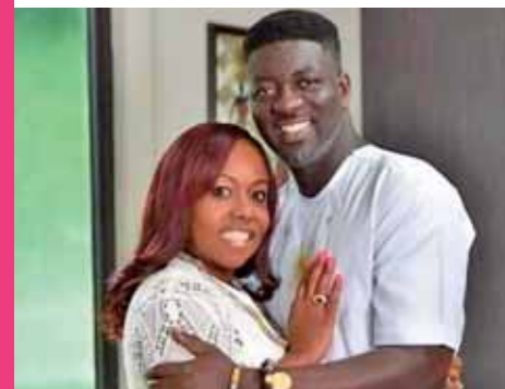
Johar Ferrara/El Siglo